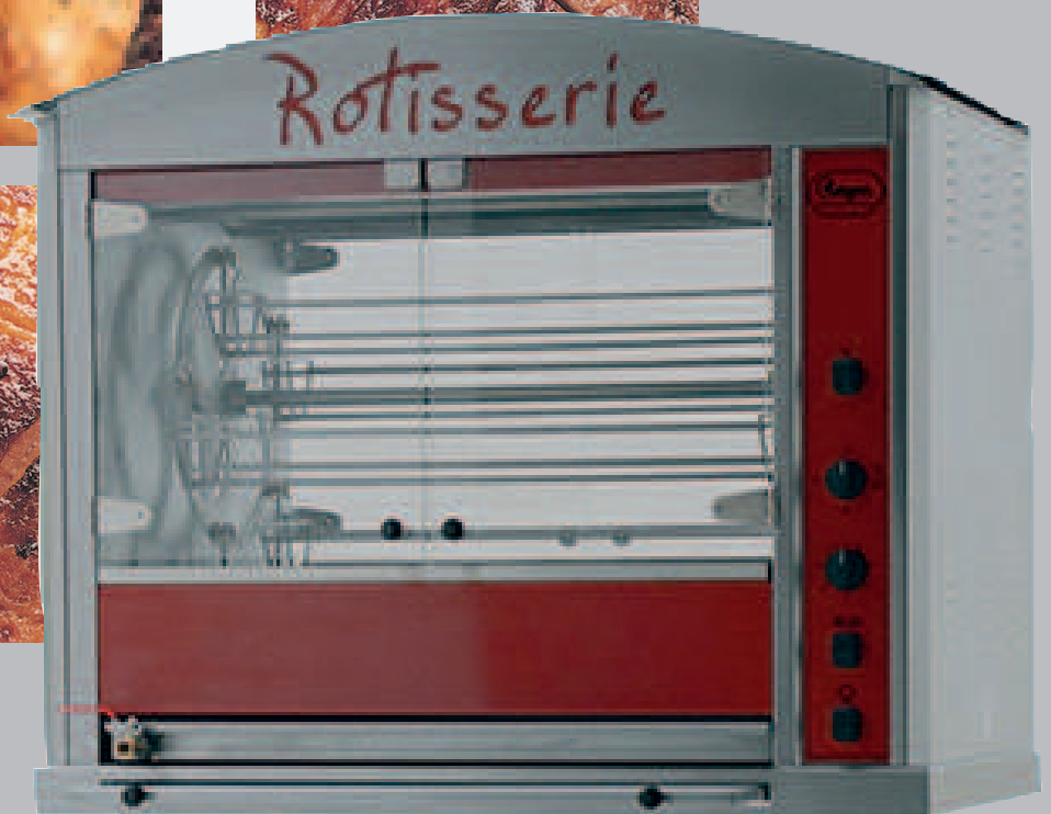
Asador presentado con plafón "Rôtisserie" y techo